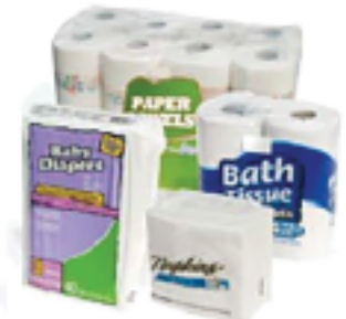
Envolturas de Servilletas, Papel Toalla, Papel Higiénico y de Pañales

"No Pone con Reciclaje! Retorno a Supermercado"