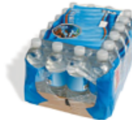
Envolturas de Cajas/Recipientes