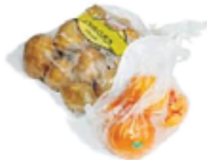
Bolsas de Fruta y de Verduras