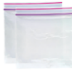
Bolsas para Almacenar Comida