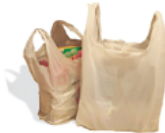
Bolsas de Mercado y de Tienda marcadas con #2 (HDPE) o #4 (LLDPE) Consejo: Guardar estos artículos en una bolsa plástica hasta su próxima visita a la tienda