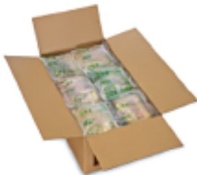
Almohadas de Aire