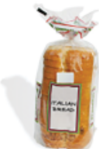
Bolsas de Pan (sacudir las migas de la bolsa)